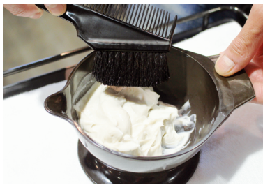
1. その場で薬剤を開封。汚れを吸着しやすいものなので、鮮度が大切です。

「毒素」とは、日常生活の中で蓄積されていくストレスや有害ミネラル、活性酸素など。「足すのではなく、引いて健康になる」というのがデトックスの共通の考え方。特に汗腺の多い頭皮から毒素を出そうというのが「スカルプデトックス」なのです。 毒素・血行不良で赤みがかった頭皮も正常な状態に戻ります。