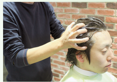
3. 頭皮をマッサージ。ツボも刺激することで、デトックス効果が上がります。