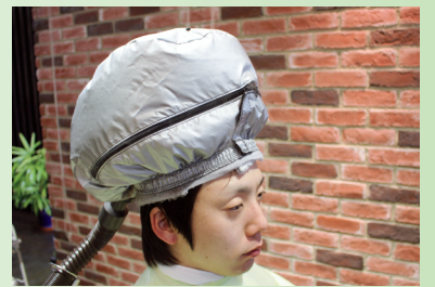
4. 低温モードで5～10分間加熱します。