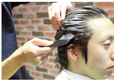
2. ハケや手、クリームを使って、頭と頭皮にまんべんなく塗布します。